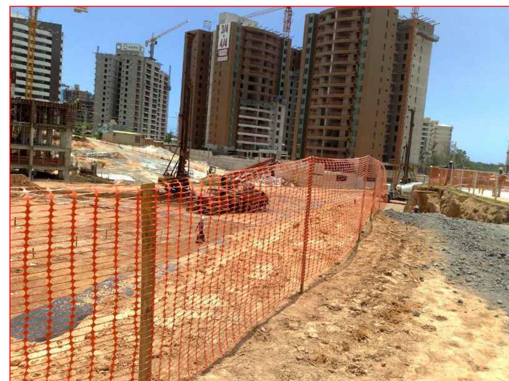
Tapume Feito de Tela Plástica na cor Laranja