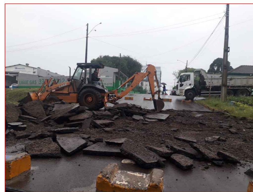
Demolição de Pavimentação Asfáltica